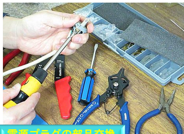
電源プラグの部品交換