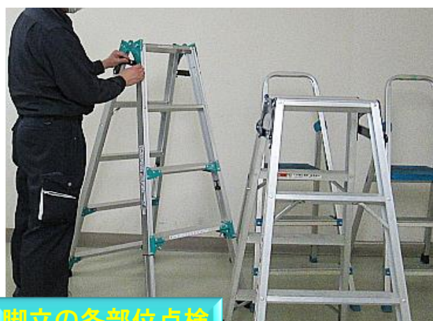
脚立の各部位点検

クリーンビジネスではKYCAの振り返りや資機材の保守点検を怠りなくつづけることで、絶えず安全と安心に尽力しています。