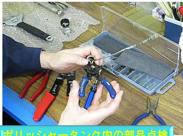
ポリッシャータンク内の部品点検