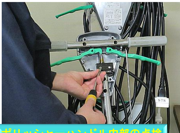
ポリッシャーハンドル内部の点検