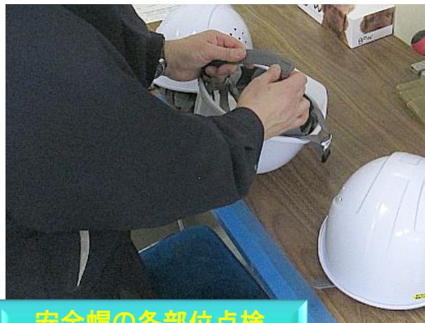
安全帽の各部位点検