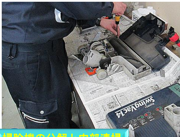
掃除機の分解と内部清掃

外観からでは解らないところは分解して確認。使用頻度の少ないものは特に細かくチェック。