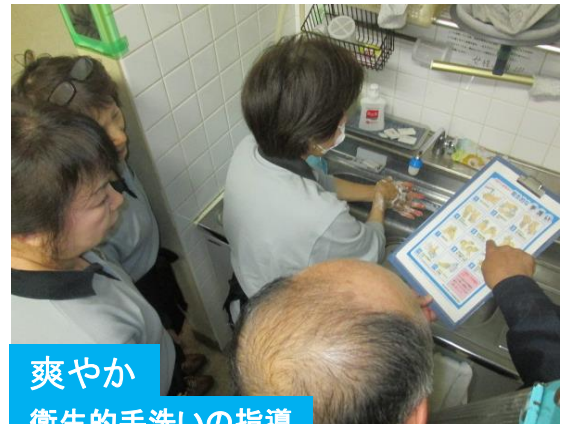
爽やか 衛生的な手洗いの指導

クリーンビジネスでは厚生労働省や日本食品衛生協会の資料を参考に”衛生的な手洗い”を実践しています。