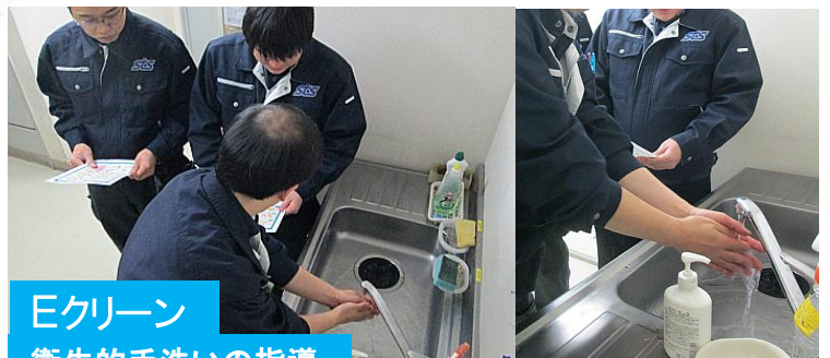
Eクリーン 衛生的な手洗いの指導

クリーンビジネスでは厚生労働省や日本食品衛生協会の資料を参考に”衛生的な手洗い”を実践しています。